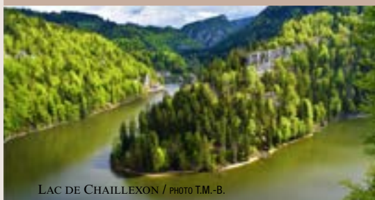
LAC DE CHAILLOUX

Morteau doit son nom aux Mortes Eaux, dues à l'envasement progressif des parties les moins profondes.