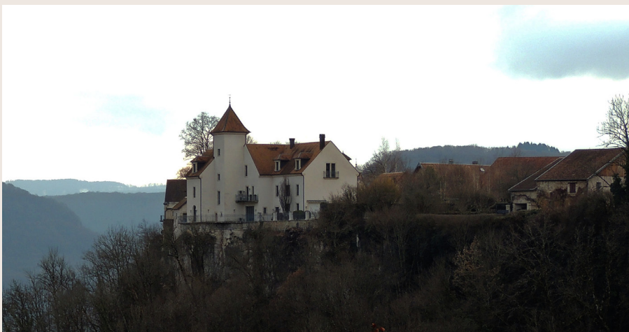
Vue du belvédère des Pins sur le hameau du Château.

> Pour éviter la partie technique prendre à la clôture le sentier à gauche qui décrit un large lacet pour rejoindre plus bas au niveau du vignoble.