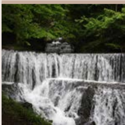
SOURCE D'ARCIER

Elles forment un ruisseau qui s'écoule vers le Doubs sur une centaine de mètres.