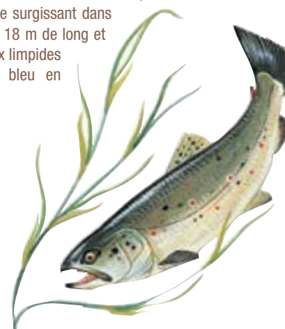
TRUITE FARIO / DESSIN P.R.

2 > La source Bleue de Cusance, dite « de l'Anse », située sur le côté droit de la reculée, est une source vauclusienne surgissant dans une vasque ovale d'environ 18 m de long et 9 m de profondeur. Ses eaux limpides prennent une nuance de bleu en fonction du temps.