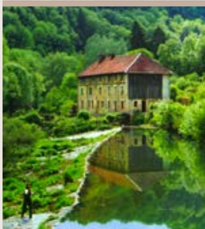
PÊCHE SUR LE CUSANCIN

Cusance. La vallée du Cusancin c'est aussi Pont-les-Moulins et son ancien moulin ou encore Guillon-les-Bains et ses anciens thermes, aujourd'hui transformés en complexe de réception, les Bains de Guillon.