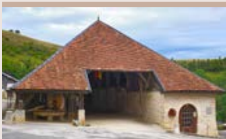
HALLE DE BELVOIR

On peut aussi découvrir un moulin à huile à traction animale. Le moulin et les halles sont classés aux monuments historiques depuis 1973.