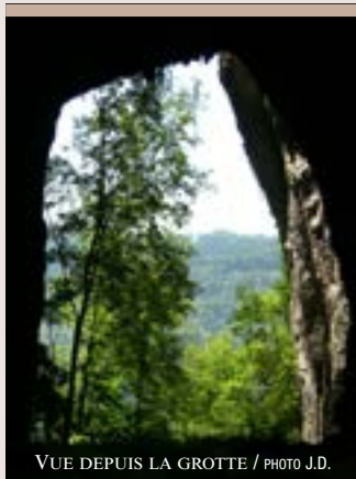
VUE DEPUIS LA GROTTÉ

La grotte, dont le fond est traversé par un ruisseau, a servi de repaire à des ours et des grands cerfs : de nombreux ossements y ont été retrouvés. Elle a également été utilisée comme nécropole, les pièces romaines sorties du sol en témoignent. C'est devant le porche, haut de 40 m et large de 25 m, que les comtes de la Roche ont édifié un château, fermant ainsi la grotte.