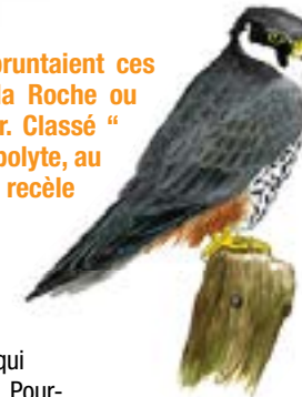
FAUCON HOBEREAU / DESSIN P.R.

Seigneurs, manants et pèlerins empruntaient ces chemins pour aller au château de la Roche ou encore à la collégiale, et commercer. Classé "petite ville de caractère", Saint-Hippolyte, au confluent du Doubs et du Dessoubre, recèle de trésors architecturaux.